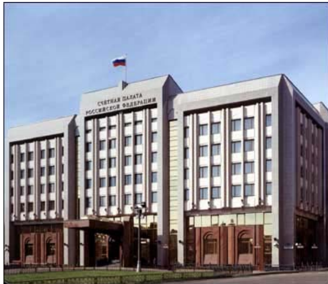
КРОВЛЯ ЗДАНИЯ СЧЕТНОЙ ПАЛАТЫ РФ