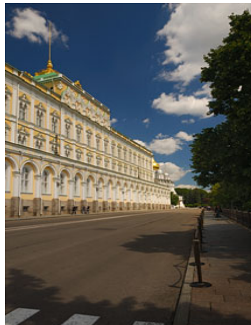
ТЕПЛОИЗОЛЯЦИЯ ТРОТУАРОВ С ГРЕЮЩИМ КАБЕЛЕМ