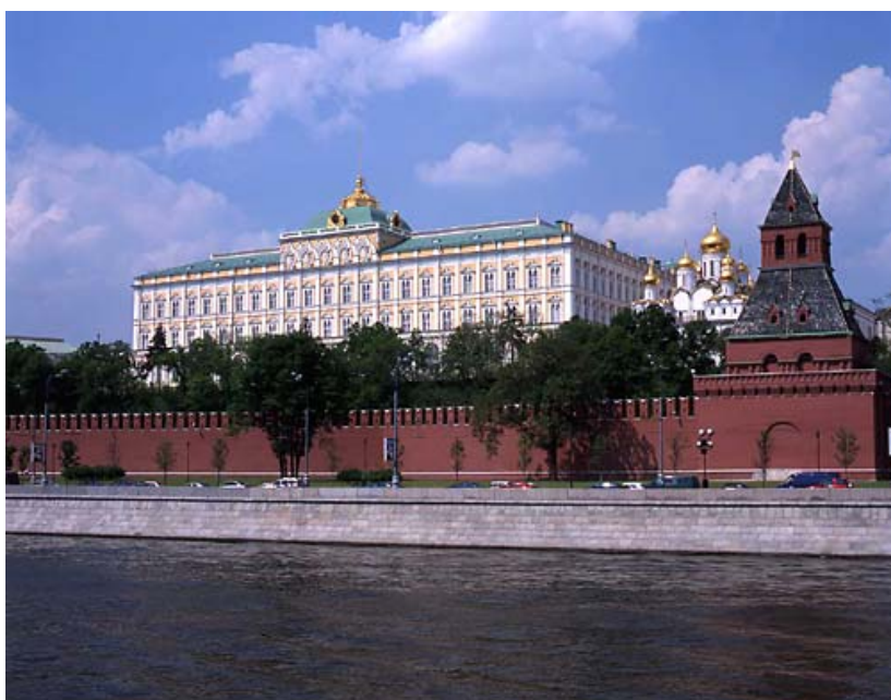
КРЕМЛЬ: КРОВЛЯ ЗИМНЕГО САДА И СТЕН ПОДВАЛА БОЛЬШОГО КРЕМЛЕВСКОГО ДВОРЦА