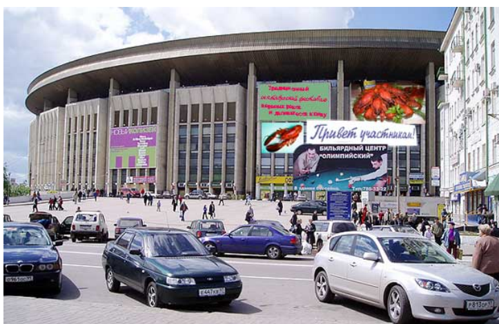
КРОВЛЯ СПОРТКОМПЛЕКСА «ОЛИМПИЙСКИЙ» В МОСКВЕ