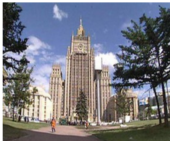
КОМПЛЕКС ЗДАНИЙ МИД РФ В МОСКВЕ