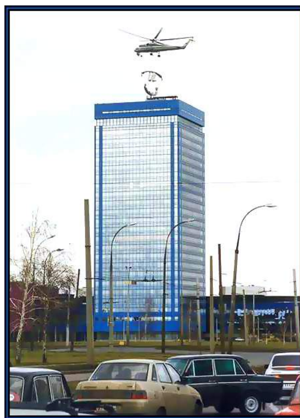
КРОВЛЯ СБОРОЧНОГО ЦЕХА ООО «АВТОВАЗ»