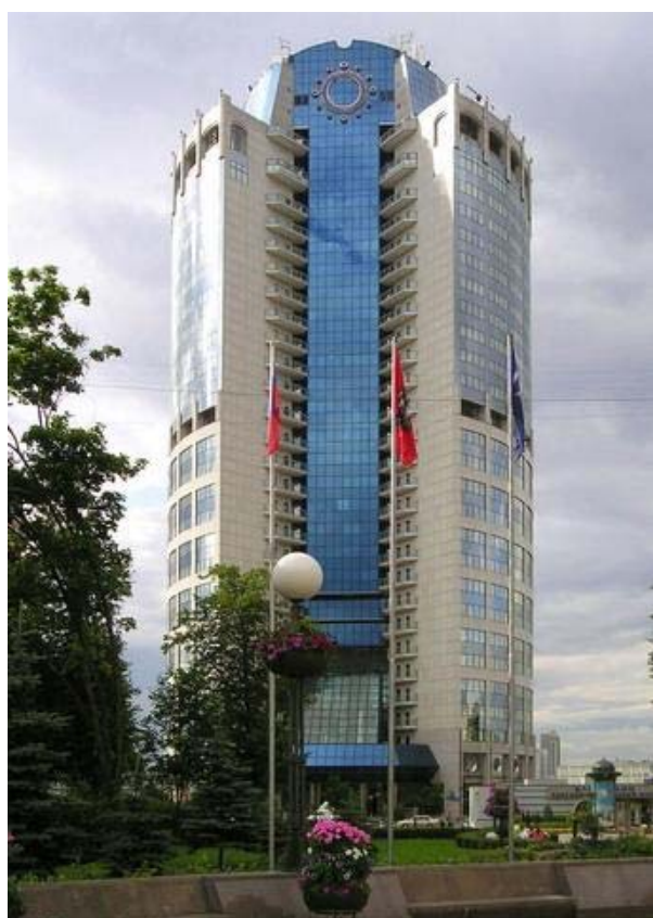
СТИЛОБАТ КОМПЛЕКСА «БАШНЯ- 2000»